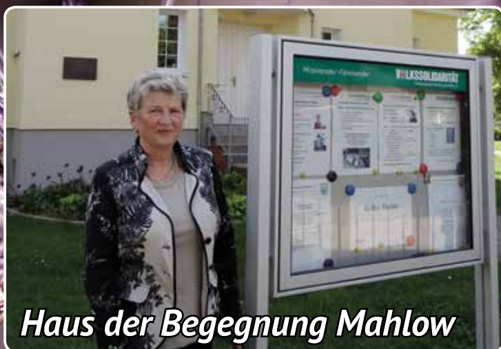
Haus der Begegnung Mahlow