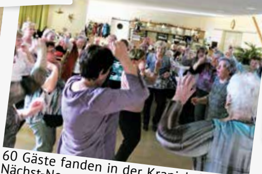
60 Gäste fanden in der Kranich-Stube in Nächst-Neuendorf Platz, wo die OG Wünsdorf ihre Frauentagsfeier abhielt. So viel wurde lange nicht getanzt.