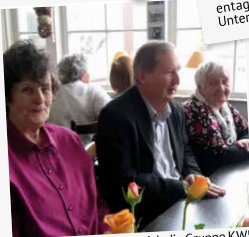
Zum Frauentag machte sich die Gruppe KW5 mit dem Bus auf nach zur Gaststätte „Neu Helgoland“, wo den Damen ein wunderbarer Tag beschert wurde.