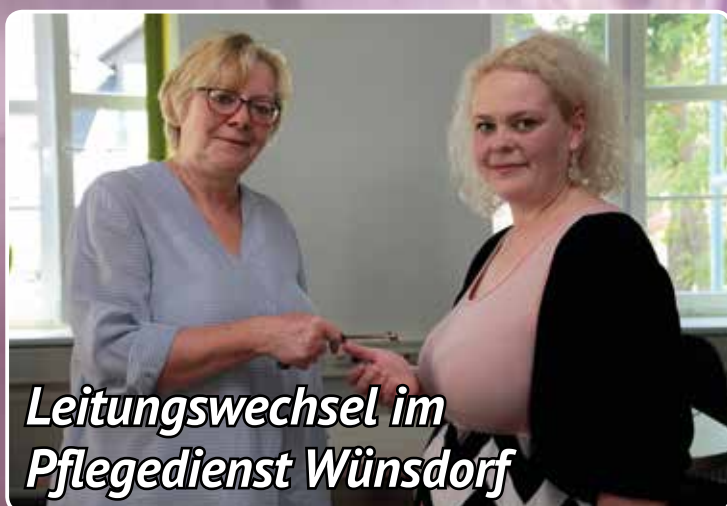
Leitungswechsel im Pflegedienst Wünsdorf