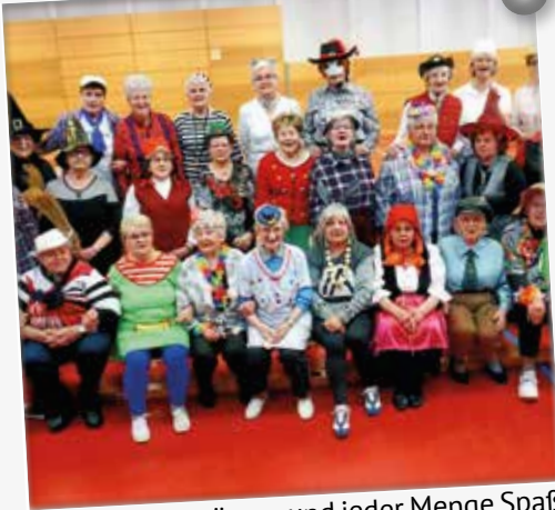
Mit tollen Kostümen und jeder Menge Spaß feierte die Sportgruppe Nord aus Ludwigsfelde eine tolle Faschingsfeier.