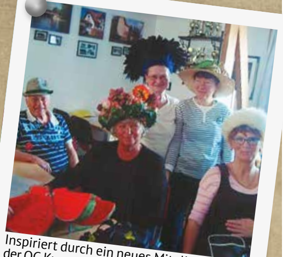
Inspiriert durch ein neues Mitglied, fand in der OG Kammersdorf im März eine „Zeitreise mit Hüten“ in der statt..