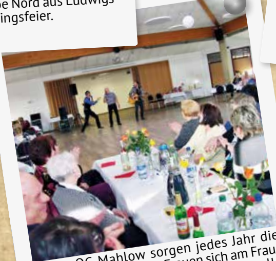
In der OG Mahlow sorgen jedes Jahr die Männer dafür, dass die Frauen sich am Frauentag wohl fühlen. Sekt, Rose und tolle Unterhaltung standen auf dem Programm.