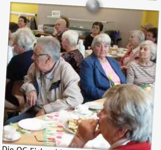
Die OG Eichwalde ehrte am 02. Mai 2018 verdienstvolle und langjährige Mitglieder in einer Auszeichnungsveranstaltung.