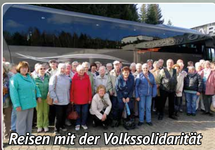
Reisen mit der Volkssolidarität