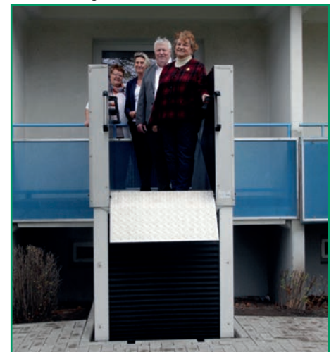
Barrierefreier Zugang zur Kleist-Stube

eine technische Ausstattung nach dem Konzept altersgerechter Assistenzsysteme, die das Leben in der eigenen Wohnung im Alter erheblich erleichtern. Diese Ausstattung können Besucher auch zukünftig im Treffpunkt vor Ort kennenlernen. Durch die zentrale Lage mitten im Wohngebiet haben die Mieter der GWG Lübben eG und die Mitglieder der Volkssolidarität über kurze Wege die Möglichkeit, die Veranstaltungen der Kleist-Stube wahrzunehmen. Neben den vorhandenen Angeboten bestehen auch noch freie Kapazitäten für die Initiierung weiterer Gruppen, wie z.B. Mütter-Baby-Gruppen, Fremdsprachenkurse oder Weiterbildungsangebote. Der Treffpunkt ist Beratungszentrum und Ort für die gemeinsame Freizeitgestaltung sowie gegenseitige Nachbarschaftshilfe; ganz