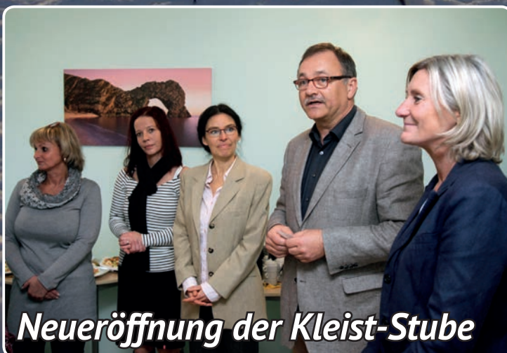
Neueröffnung der Kleist-Stube